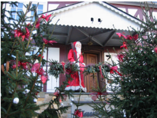
Auch dieses Jahr grüßt der lebensgroße Nikolaus vom Haus Herbig aus. Das Schmücken der Weihnachtsbäume haben traditionell die dritten Schuljahre der Burbacher Grundschule übernommen.

stiften. Spätestens beim Museumsfest wird man eigene Karten damit gestalten können.