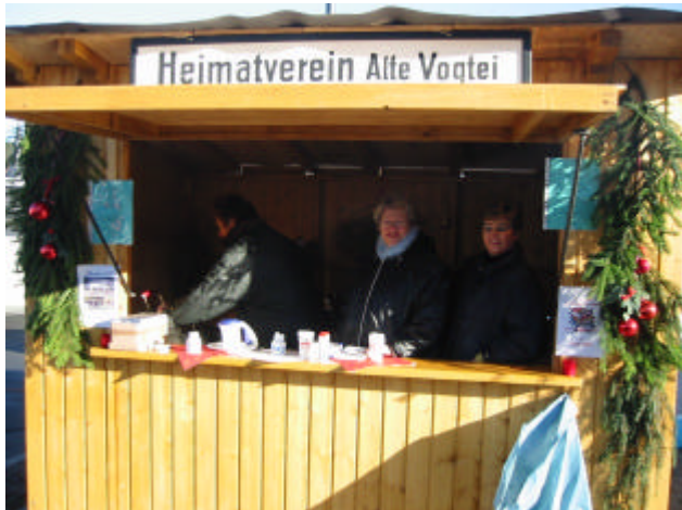
Der Stand des Heimatvereins bei Weihnachtsmarkt am 7. Dezember 2003 in der Burbacher Ortsmitte.

Leider kommt es aber immer wieder vor, dass Bänke mutwillig beschädigt oder gar Böschungen hinter geworden werden. Dabei gehen meistens Banklatten zu Bruch, die dann ersetzt werden müssen. Die dafür notwendige Vorratshaltung an Latten wurde gerade wieder aufgefüllt, Nachdem die Waldgenossenschaft das Holz bereitstellte, hat die Firma Moses die Bohlen zugeschnitten, gelagert, gehobelt und gefräst. 38 Rückenlehnen und 51 Sitzlatten stehen wieder bereit. Dafür möchten wir uns ganz herzlich bedanken.