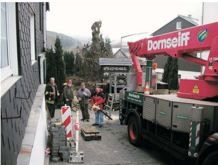
Schweres Gerät ist beim Stutzen der Bäume im Einsatz. Auch hinter dem Haus ist an den Außenanlagen schon viel gemacht worden.

Die gute Nachricht kam noch kurz vor Weihnachten: Die NRW-Stiftung unterstützt das Projekt Haus Dilthey mit 30.000 Euro. Konkret wird gefördert, was für die Aufstellung der alten Bleisatzmaschine als Erweiterung unseres kleinen Druckereimuseums erforderlich ist. Das ist im wesentlichen die Restaurierung der Remise. Die hat inzwischen schon ein komplett neues Dach bekommen, die in der Remise sichtbaren Fachwerkwände sind bereits komplett saniert und Türen und Tore erneuert. Unzählige Arbeitsstunden sind bereits erbracht worden, die man bisher von außen noch gar nicht so richtig würdigen kann. Um so schöner ist deshalb jetzt die Förderung durch die Stiftung: Das bedeutet eine erhebliche Anerkennung für die Arbeit derer, die dort jetzt seit Januar letzten Jahres meist an drei Tagen in der Woche arbeiten und schon unglaublich viel für unseren Ort geleistet haben.