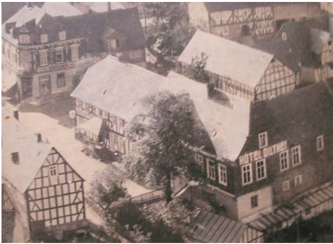
Ein Luftbild vom Haus Dilthey aus den 50iger Jahren des letzten Jahrhunderts.