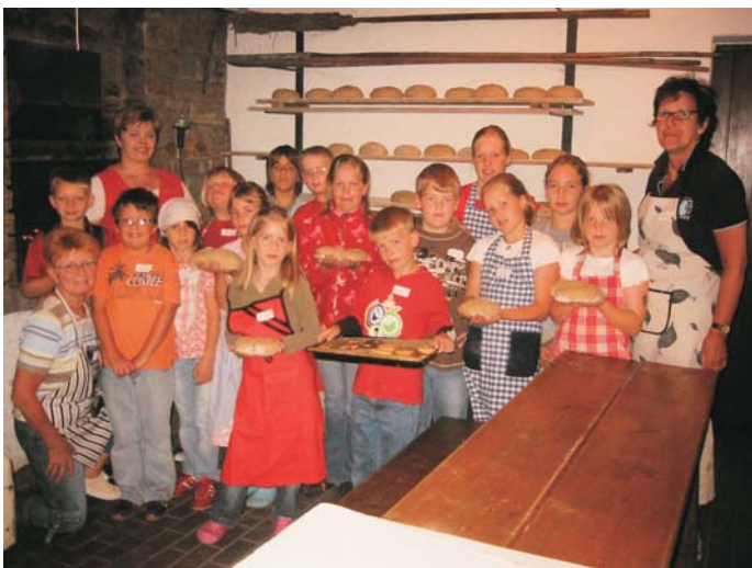
Im Rahmen der Ferienspiele kommen 15 Kinder ins Backhaus und backen selbst Brote und Pizza. Ein schöner Ferientag.

Mit Stühlen aus alten Beständen im Haus Dilthey hilft der Burbacher Heimatverein den Würgendorfer Kollegen bei der Bestuhlung des Heimathauses, das gerade restauriert wird. Die ehemalige Saalbestuhlung wurde vor Jahrzehnten nach allen Regeln der Schreinerkunst gefertigt und wird im neuen Haus des Würgendorfer Heimatvereins sicher noch lange sehr gute Dienste tun.