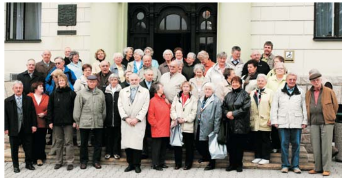
Die Burbacher Besuchergruppe vor dem Rathaus in Tanvald.

26. Oktober, Sonntag, Museum geöffnet Kaffee und Waffeln werden angeboten