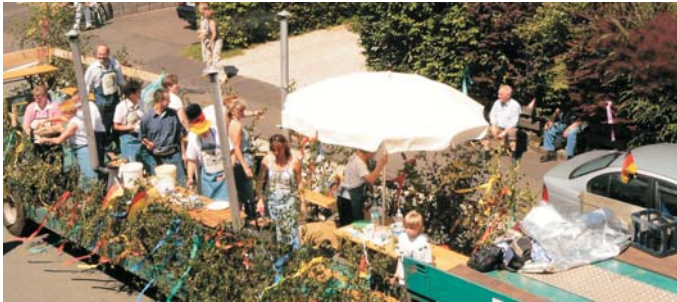
Rauchende Öfen fahren per Sattelzug durch Wahlbach.

Rauchende Öfen auf einem Tiefselver der Firma Dornseiff und der vereinseigene Traktor vorne weg. Das war der Beitrag des Heimatvereins Alte Vogtei e.V. im Festumzug beim Wahlbacher Feuerwehrjubiläum. Den Zuschauern wurden Mini-Plätze und Schmalzbrote vom Wagen herunter gereicht. Mit dem gleichen Fahrzeug war der Heimatverein schon in Lützelnd dabei und im August auch wieder beim Würgendorfer Feuerwehrjubiläum.