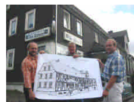
Das Haus Dilthey heute (links) und zu Beginn der Bauarbeiten (oben) noch mit morschen Fenstern und Eternit-Fassade.