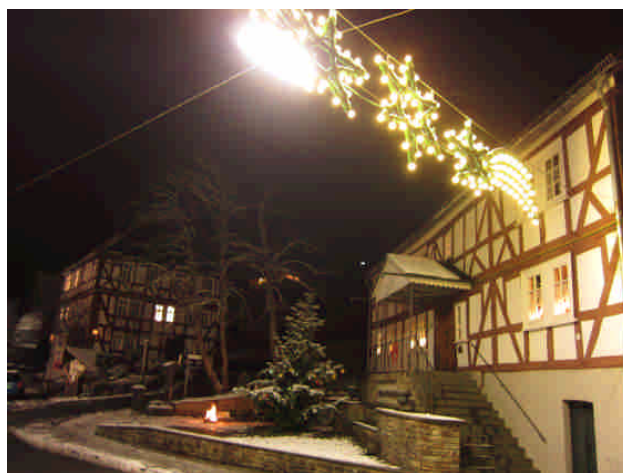
Weihnachtsstimmung vor dem Haus Herbig.

In der nächster Zeit müssen wir unserem Museum deutlich mehr Aufmerksamkeit widmen. Die Ausstellung muss teilweise überarbeitet werden und dann auch neu dokumentiert werden. Dazu brauchen wir dringend weitere Helferinnen und Helfer, die sich verantwortlich um einzelnen Bereiche kümmern oder die einfach nur gerne mitarbeiten. Auch für die Durchführung des Museumsfests und des Kunsthandwerkermarkts können wir noch Hilfe brauchen. Bitte einfach ein Vorstandsmitglied ansprechen!